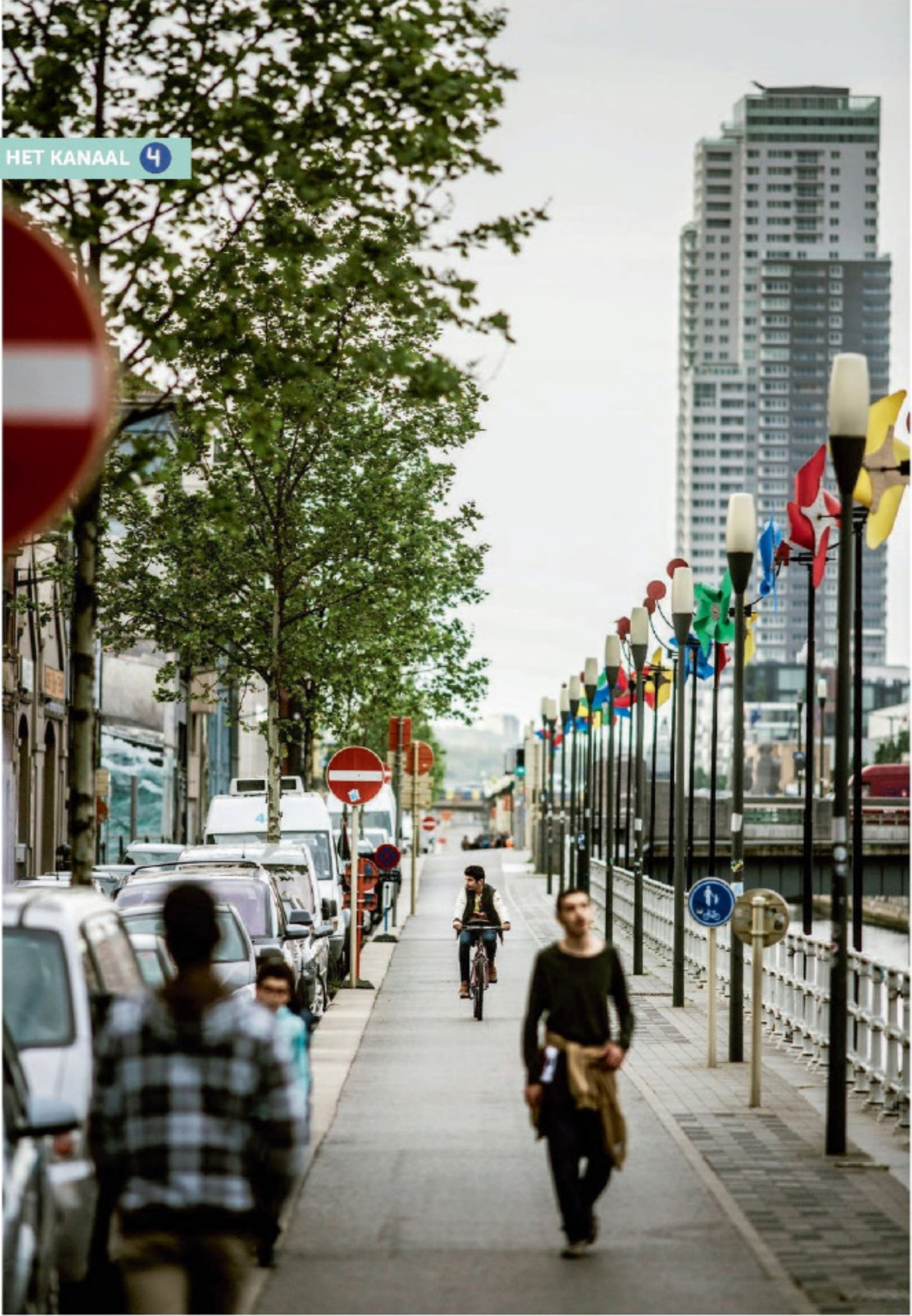
4 HET KANAAL