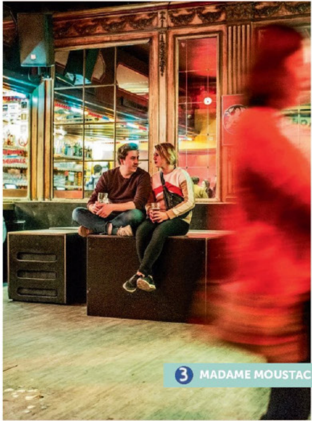
3 MADAME MOUSTACHE